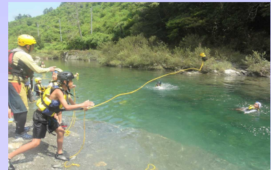
水難事故防止講習