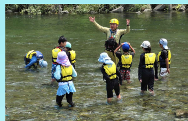
水難事故防止講習