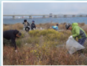
ナルトサワギク駆除(R2.12.19)

吉野川の自然や歴史に触れ、吉野川を深く知っていただく事を目的に、 皆さんと一緒に吉野川に出かけ、観察会や、外来種駆除、洪水遺跡について学ぶ講座 を開催しています。