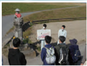
自転車で巡る吉野川歴史探訪 (R2.11.15)