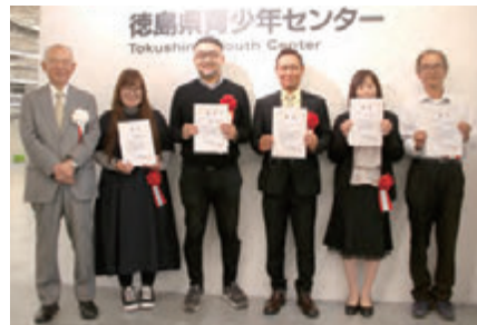
授賞式に出席された皆さん。機材やピユースポットなど互いに興味津々で情報交換していました

「吉野川の自然・ひと・恵み」をテーマに、初の「#吉野川サイコー」インスタフォトコンテストを開催しました。ご応募いただいた377点は素敵な作品ばかり！選考の結果、入賞作品が決定。10月29日にとくぎんトモニプラザにて授賞式を行いました。